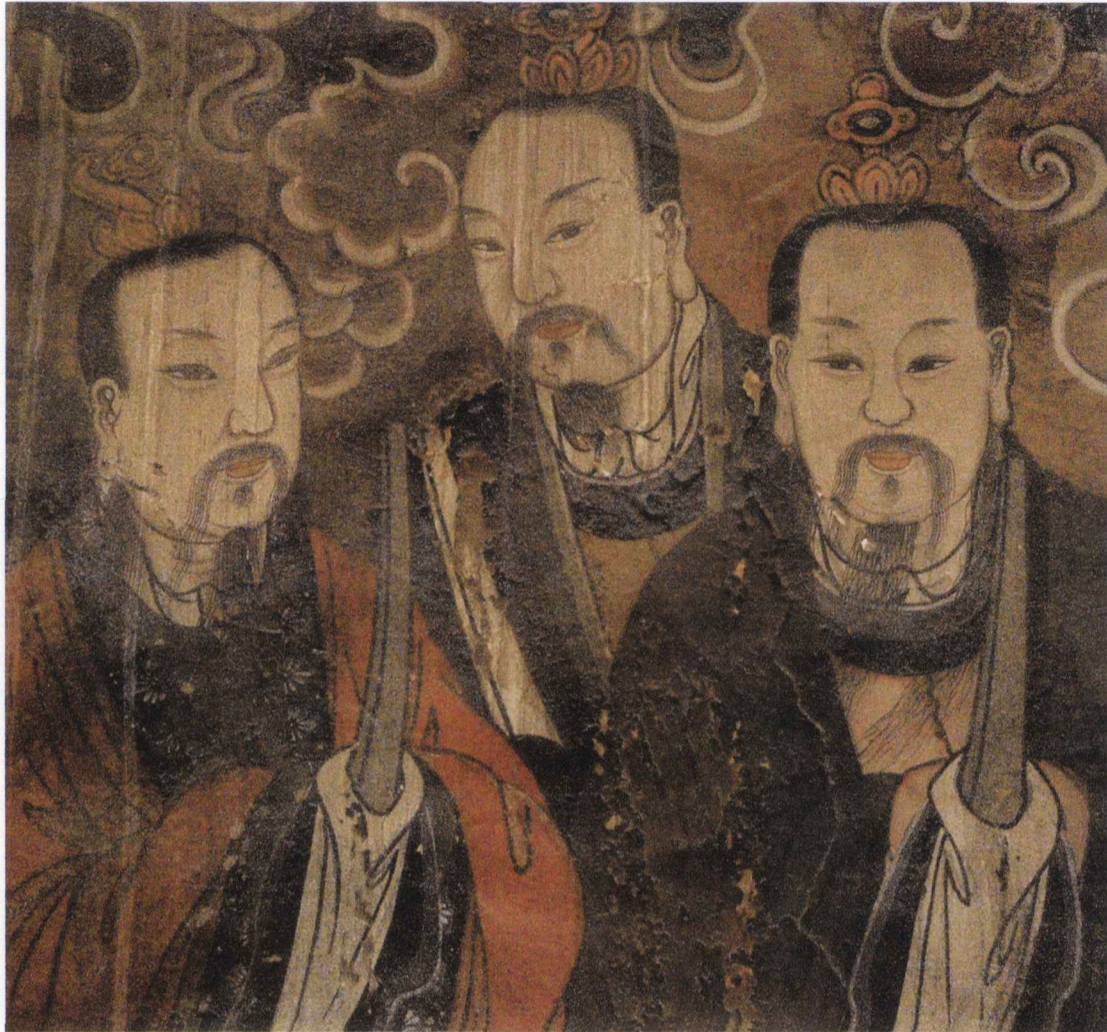
真武大殿后殿诸神图局部之一