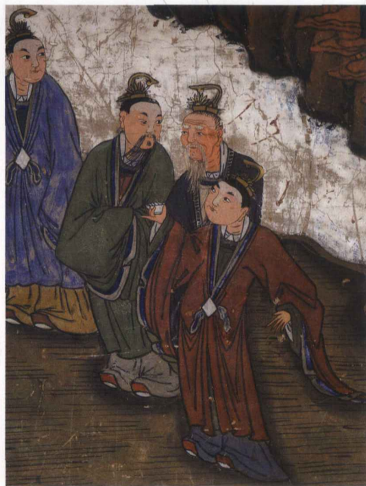
太阴太阳殿执事图