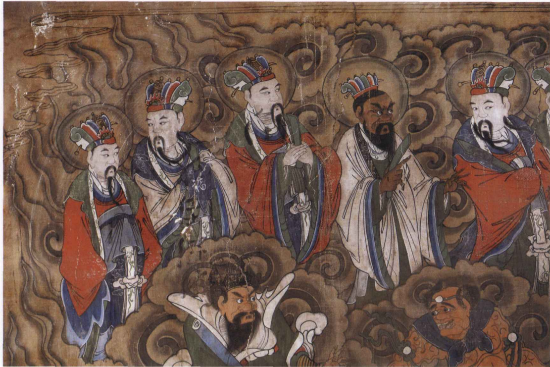
三清殿东配殿南斗众神图