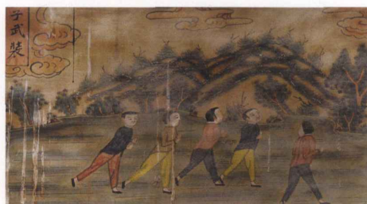
碧霞宫童子武装图