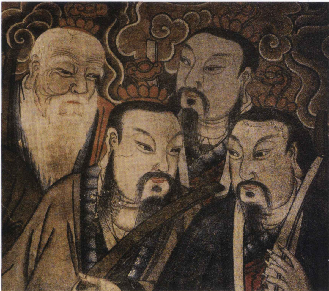
真武大殿后殿诸神图局部之二

神绘于彩云之中，形体略大于真人，均头戴冕旒，手持笏板，或老或少，或温慈或威凛，这就是三十二天帝。据郭若虚《图画见闻志》卷三记载，北宋初期著名画家武宗元曾在洛阳上清宫绘制三十六天帝，其中的赤明阳和天帝是按照宋太宗的面容所画，宋真宗看到后十分惊奇，“焚香再拜，且叹其画笔之神，伫立久之”。白云观的三十二天帝图，从风格上看，虽应在清代，但应是宋代传统的延伸。