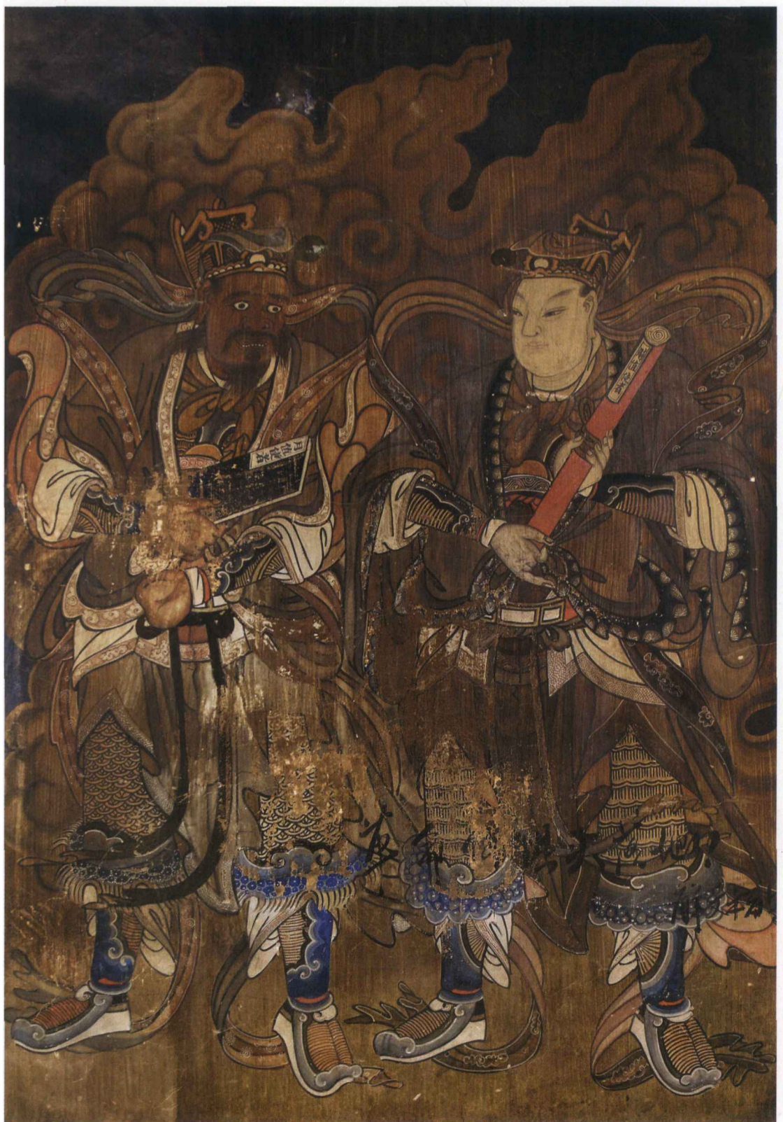
真武大殿月、时值使者

创建于明万历年间（1573~1620年），是白云观主要建筑之一。大殿为两层建筑，上层三面绘壁画，正壁，在玉皇坐像（新塑）的背后绘二龙戏珠图，一龙腾于云端，一龙潜于水中，张牙舞爪，气势非凡。几乎全用水墨完成，仅在面部着有少许朱砂色。左右壁绘众神朝圣图，分上下两排，每排8位，共32身神像。众