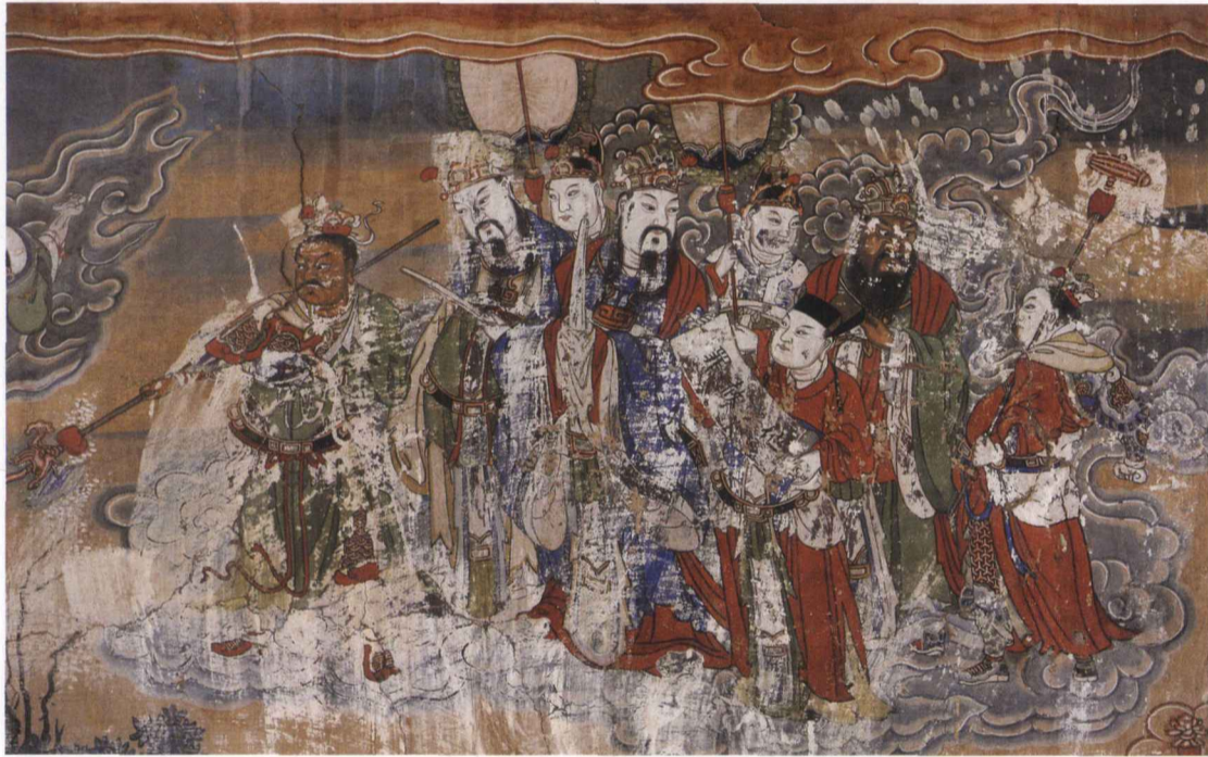
三官殿三官出巡图

展开纸卷状，向众神呈现，动作及其夸张。举“清道”的鬼卒、举幡童子和武士亦如左壁。下端绘人间图像，左下角绘一组人物，中间是一位肥胖的官吏，着橙红色清朝官服，面对一红衣女子作挥手状，手指纤细，大腹便便，神态傲慢。后有木栅栏和假山石，前有一仆正牵马于树下。与左壁相对应，一官一民，表现了不同的社会层面。