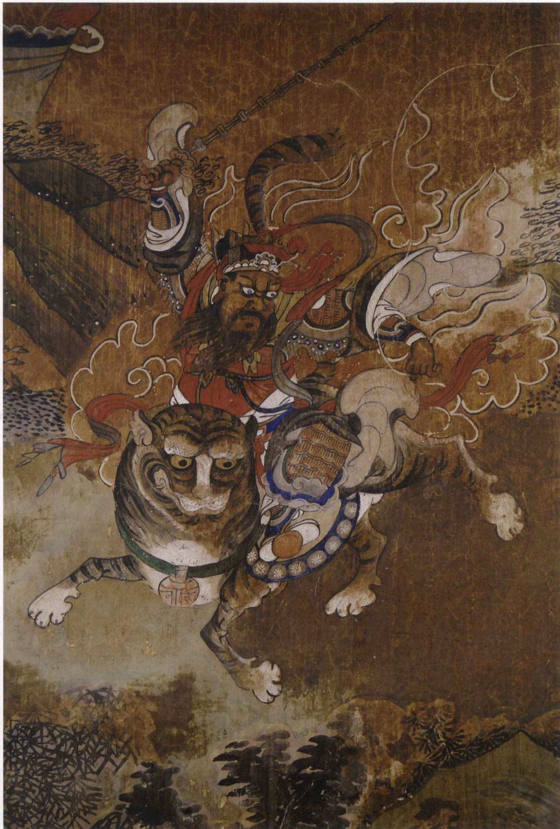
头天门右厢赵公明元帅伏魔图

老子八十一化的故事源于魏晋时期的《老子化胡经》，在宋代开始以连环画的形式广泛流传，但在元代遭到朝廷禁毁，明代以后又恢复。现存相同题材较早的壁画，有邻近陕西的甘肃东部庄浪县紫荆山老君庙，现仅存22幅图，藏甘肃平凉博物馆，各图存有榜题，时代为元或明初。山西则有浮山老君洞内的石刻线描画，较为完整，刻于明代嘉靖辛酉（1561年）。另有甘肃兰州金天观壁画，规模宏大，约作于明代永乐年间（1403~1424年），但实物已不存，仅存1965年拍摄的黑白照片。另外还有一些不同的印刷刊本。山西浮山石刻有确切时间，与白云观壁画相似的是，每一图也都留有榜题位置，即在图下方左或右画有长方形框，但只有其中第六十五化刻有供养人姓名（“府吏陈万□鉴造”），其余长方形框均为空白。显然这是来自壁画的形式。白云观三清殿大殿前壁砌有明崇祯癸未岁（1643年）《白云山重建庙