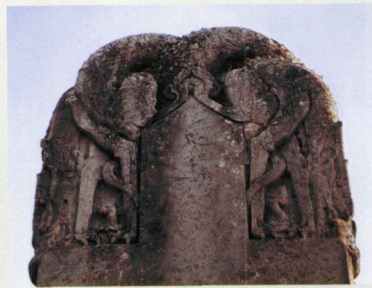
图十 乾陵无字碑 局部