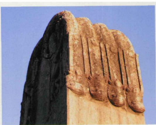
图九 乾陵无字碑 局部

而成的。根据史料记载及考古新发现证明这是一种误解。一九五七年，考古人员在整修倾覆及埋没的石人像时，发现倒埋于地下的石人像背后刻有国名和官职姓名，看清字迹者仅有六尊，即木俱罕国斯□□勒，于闐国□尉迟□□□，吐火罗王了持□□达健，吐火□□□□阿史阿忠节，使□力贪开□于，□仙□□河□□延。由此证明，这批石人像在初雕时，每个石人像背后背部都刻有姓名、职衔、族别或国别等文字。 北宁元□□□年间，陕西转运使游师雄，曾考察过这六十一石人像背部所刻的文字，并转刻成四块碑文，立于石人像东西两侧，不幸碑刻现已毁失。元朝人李好文在编《长安志图》时寻得其中三碑，录得补阙者三十九人。后经著名历史学家陈国灿先生考补，现存名实际只有三十六位。它们中，除吐谷浑、吐蕃、突厥首领(即蕃将)各二人外，绝大部分为唐安西、北廷、安北等都护府属下的地方官员或少数民族首领(即蕃将)。这