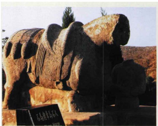
图六 乾陵石马与牵马石人