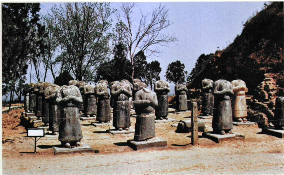
图十一 乾陵六十一蕃臣像

三十位名单中，绝大多数前面冠一「故」字证明在立像时，这些人已经故世，故不可能成为参加高宗葬礼的宾客。在中国历代帝王陵墓中，唯有唐昭陵和乾陵有蕃将石刻，这一石刻反映了唐太宗、唐高宗时期民族融合、民族团结和统治集团多民族成分的历史见证。也是这些蕃将对唐朝皇帝恭谨臣属，侍卫宫阙的历史缩影。所以说这些石人像的模特是以蕃将等为模特。根据乾陵无字碑上的《朗君行记》记载推断，这六十一石人像原来还经过彩绘。唐太宗昭陵前只立了十四尊石人像，而乾陵则立了六十一尊，这说明唐朝到了高宗、武后时期的